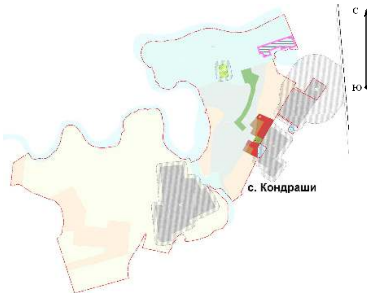
Схема использования элемента планировочной структуры М 1:25 000